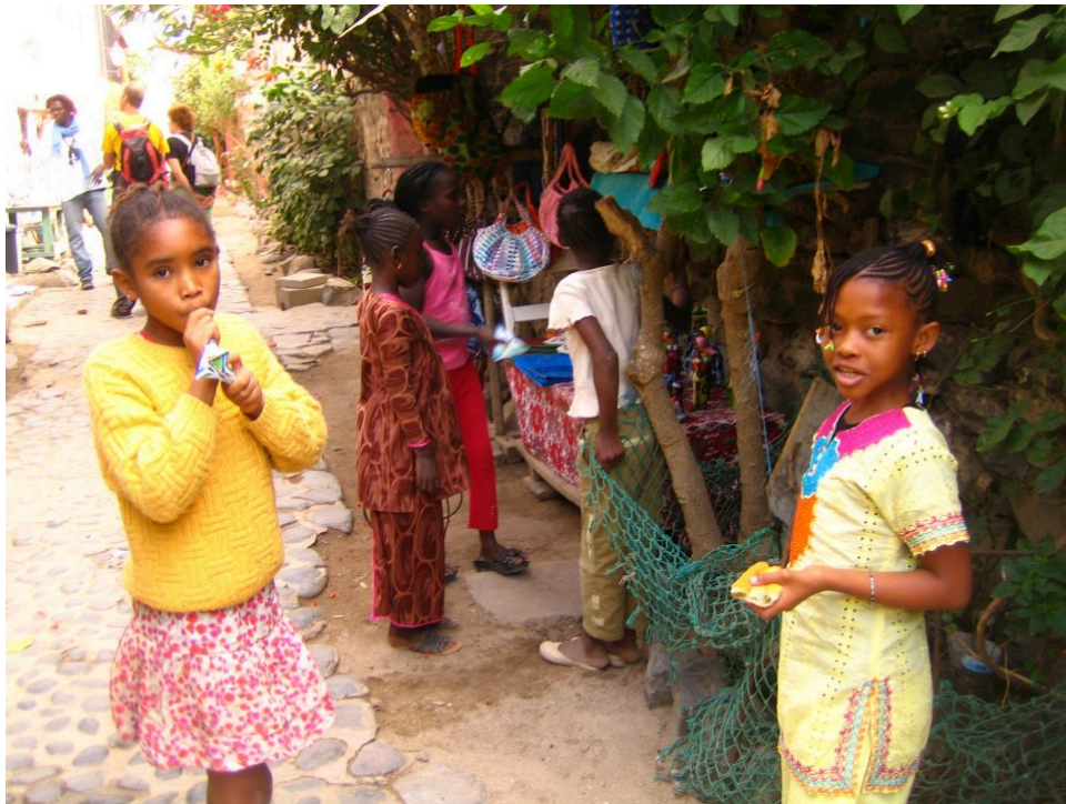
Bambine al mercato di Gorée

La stagione della tratta di esseri umani a Gorée si chiuse definitivamente nel 1846 quando sull'isola vennero sbarcati 250 schiavi liberati al largo delle coste dell'Angola su una nave negriera illegale. Dopo 3 anni passati a Gorée questi esseri umani, finalmente liberi, chiesero di potersi stabilire in Gabon dove fondarono la città di Libreville.