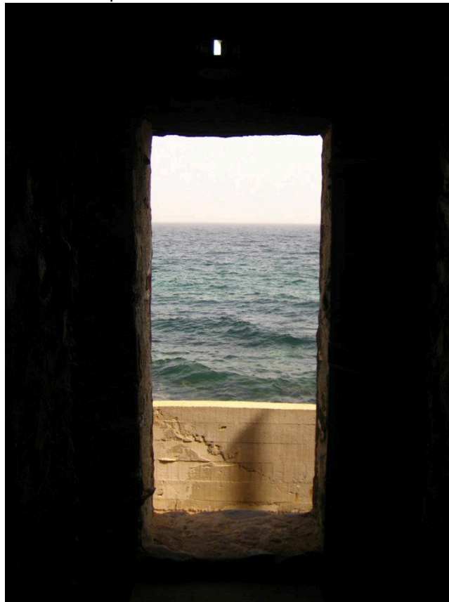
“La Porta del Non Ritorno” – Maison des Esclaves – Isola di Gorée

“La Porta del Non Ritorno” è alla fine di un lungo corridoio, stretto e buio, che si affaccia direttamente sul mare. Percorrerlo, cercando di immedesimarsi con le vittime di questo orrore (cosa peraltro impossibile) fa venire i brividi. I ribelli, i recalcitranti, i più deboli, venivano gettati vivi nelle acque sottostanti, sempre infestate dagli squali in attesa di nuove prede.