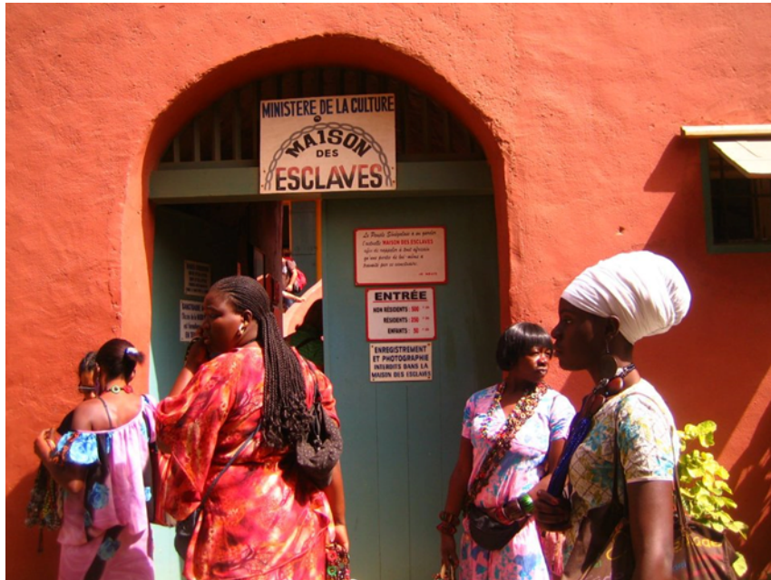
Ingresso della “Casa degli Schiavi”, Isola di Gorée

Prima di arrivare in Senegal non avevo mai sentito parlare di Gorée e, nonostante la sua forte valenza simbolica, pochi in Europa la conoscono. L’isola è nella baia di Dakar, a 3 chilometri dalla terraferma e a circa 20 minuti di navigazione dal porto della capitale. Per un lungo e doloroso periodo della storia dell’umanità l’isola di Gorée, poco più di 36 ettari, è stata uno dei punti focali dell’economia mondiale.