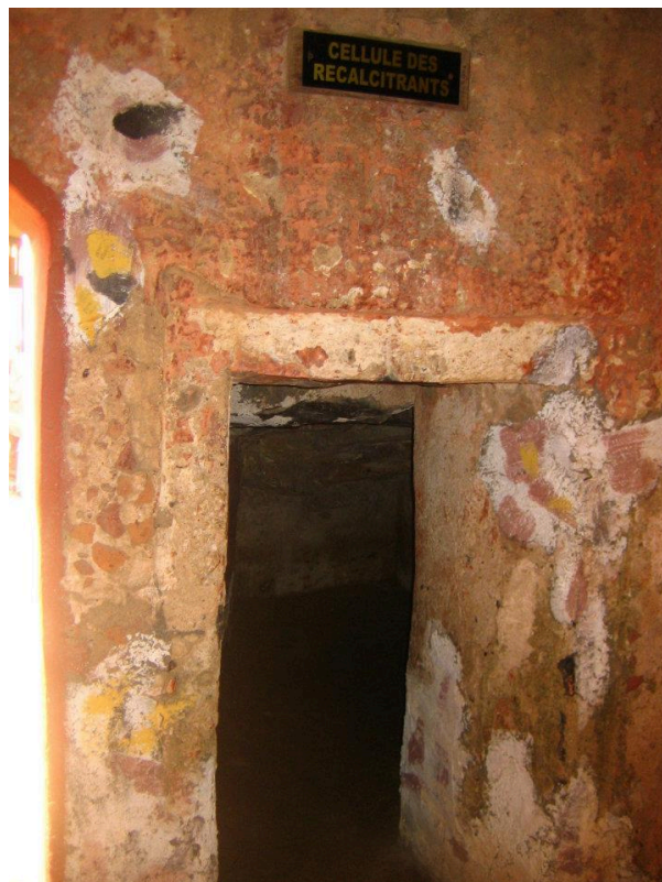
Cella dei recalcitranti – Maison des Esclaves Isola di Gorée