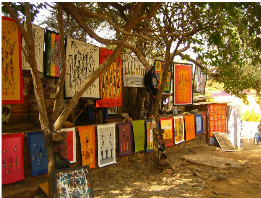
Mercato d’arte all’aperto – Isola di Gorée

Gorée fu usata per gli imbarchi fino al 1848, quando, cessato per legge il commercio degli schiavi, perse di interesse strategico. Ora invece è una tappa obbligata per i turisti che arrivano a Dakar. Molti però la visitano soprattutto per la bellezza dell’isola e delle case in stile coloniale, circondate dalle buganvillee in fiore, e per visitare il mercato dell’arte all’aperto, dove gli artisti locali espongono le loro coloratissime opere. È infatti il luogo preferito di pittori, musicisti e scultori che spesso vi risiedono stabilmente, specialmente nella zona alta dell’isola, chiamata “Le Castel”. I musicisti di Gorée perpetuano la tradizione della musica djembé e della danza tradizionale locale. Gli abitanti sono circa 2.000, in prevalenza di religione musulmana, ma ci sono anche alcuni cattolici.