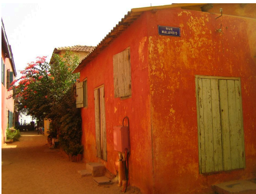
Casa di rue Malavois – Isola di Gorée