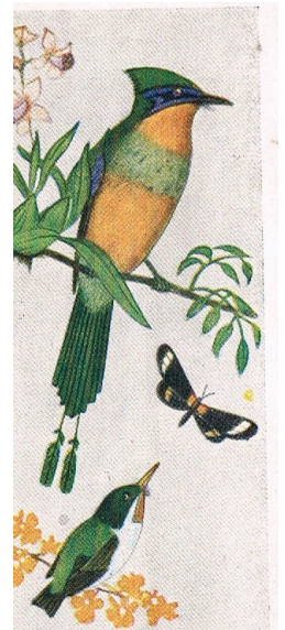
Momotus momota mexicano

L'immagine serve a dare una proporzione dell'uccello.