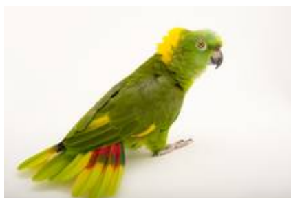
Classica immagine della Amazzone o. auropalliata, del Nicaragua.

Per contro l'alimentazione usata in cattività può tranquillamente avvicinarsi a quella di origine, con un buion misto di semi vari, frutta di stagione, pane secco, fichi secchi o maturi, mais ancora allo stato latteo, sorgo, barbabietole rosse bollite e germinato somministrato con cautela.