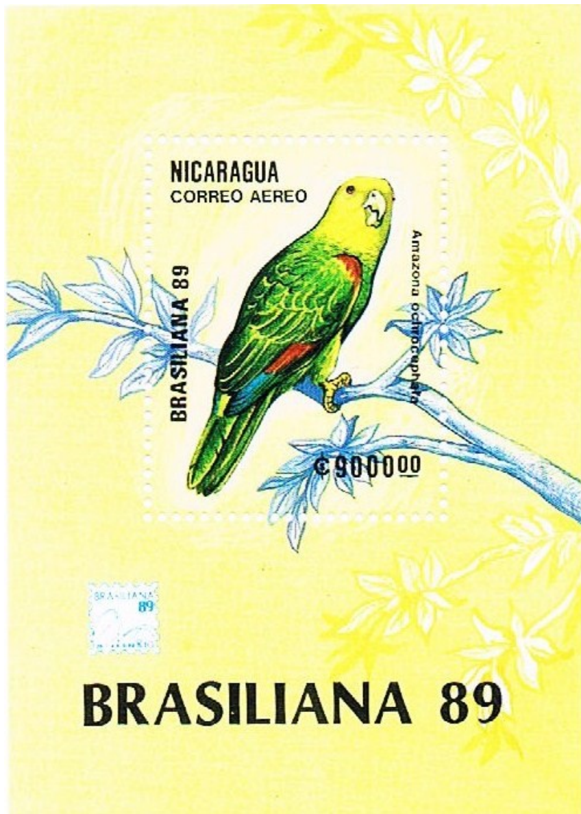
Amazzone testa gialla Nicaragua

Amazona (ochrocephala) oratrix , Ridgway 1871.