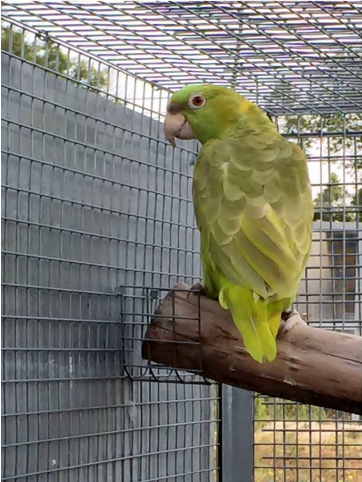
Amazona o.auropalliata di mutazione Isabella