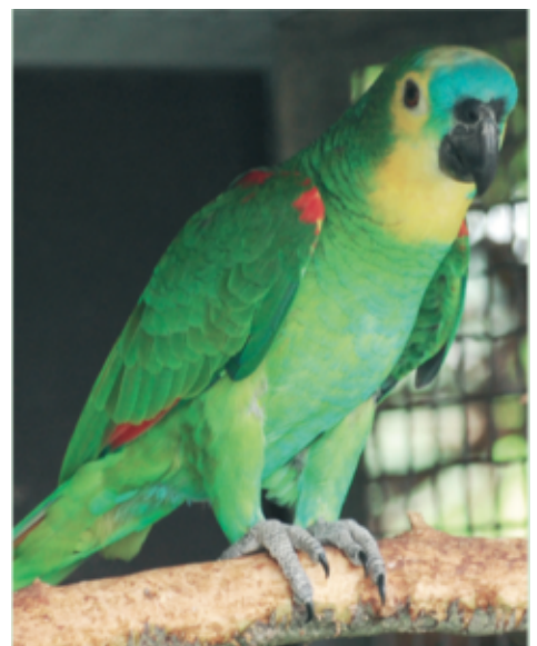
Tipica Amazona aestiva Bahia femmina

Per esempio nel Pantanal del Mato Grosso, si ha un'area di transizione o meglio di confine in cui il colore nella curvatura dell'ala è un misto di rosso e giallo (Sick, 1993).